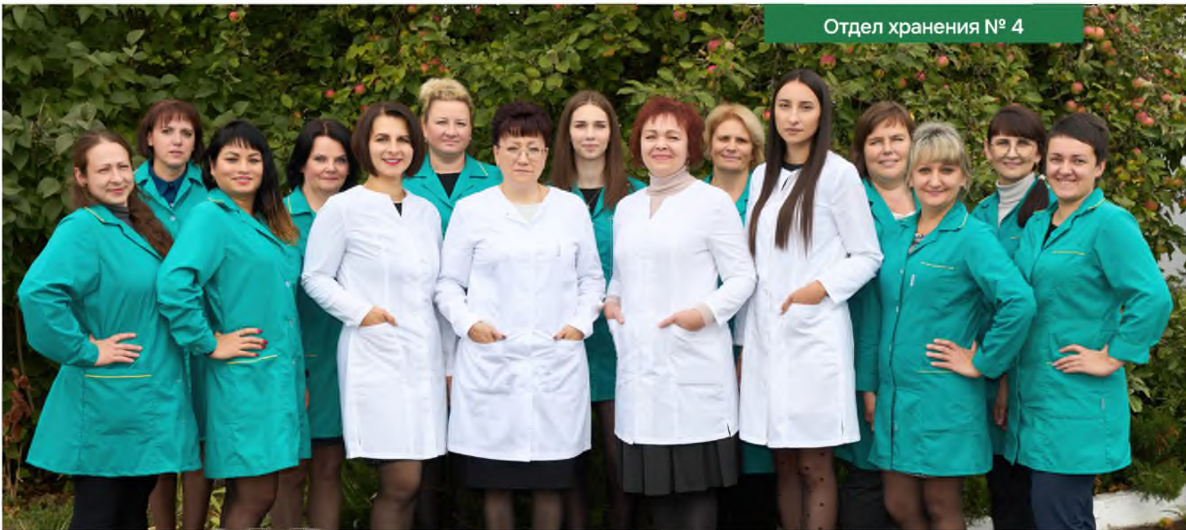
Отдел хранения № 4