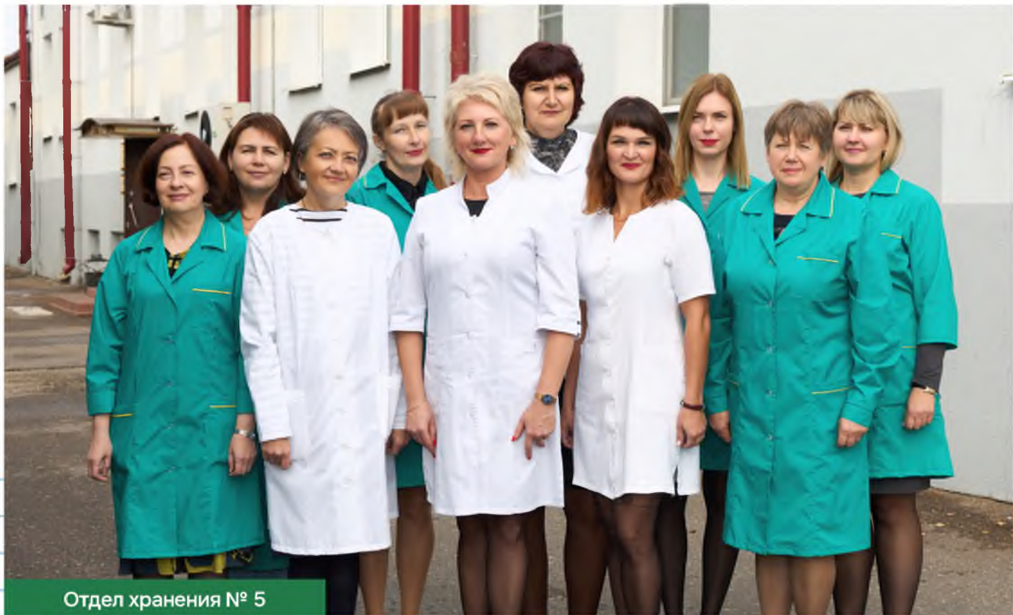
Отдел хранения № 5