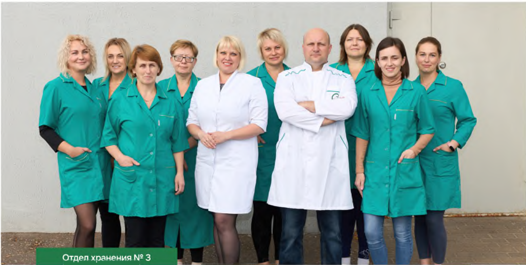
Отдел хранения № 3