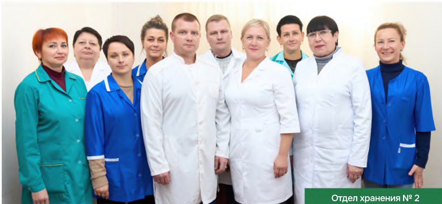
Отдел хранения № 2