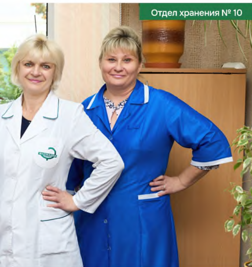
Отдел хранения № 10

автобус, трактор и погрузчик. Грузовые транспортные средства оборудованы холодильно-отопительными установками для обеспечения надлежащих условий транспортировки товаров, имеют GPS-навигацию.